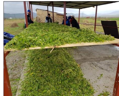
Уургийн агууламж өндөртэй хорголжин багсармал тэжээл үйлдвэрлэл. МAAЭШХ-ийн Төв аймаг Батсүмбэр дахь Олон наст ургамлын туршилт судалгааны төв, “Буурцагт ургамлаар уурагт тэжээл үйлдвэрлэх” инновацийн төсөл 2017-2019

Дарш бэлтгэхдээ хөгц мөөгөнцөр, бактери өсөлтгүй, хуурай орчинг бүрдүүлсэн байна. Хуурай бодисын 83 хувиас багагүй байна. Хүчилтөрөгчгүй орчинг бий болгоно. Тэгвэл даршийг жил, түүнээс илүү хугацаагаар хадгалж болно. Дарш бэлтгэхийн тулд эхлээд ургамлаа хадаад бага зэрэг хатаана. Түүхий эдүүдийг ижил хэмжээтэй, жишээ нь