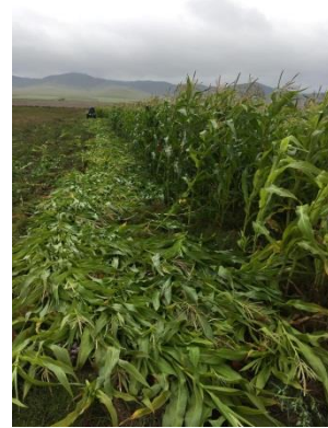
Вандуй, царгас, эрдэнэшишийн хураалт. МAAЭШХ-ийн Төв аймаг Батсүмбэр дахь Олон наст ургамлын туршилт судалгааны төв, “Буурцагт ургамлаар уурагт тэжээл үйлдвэрлэх” инновацийн төсөл 2017-2019