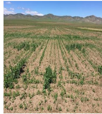
Эрдэнэшиш, царгас. МAAЭШХ-ийн Төв аймаг Батсүмбэр дахь Олон наст ургамлын туршилт судалгааны төв, “Буурцагт ургамлаар уурагт тэжээл үйлдвэрлэх” инновацийн төсөл 2017-2019