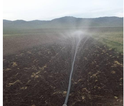
Царгас, эрдэнэшишийн тариалалт. МAAЭШХ-ийн Төв, Батсүмбэр дэхь Суурин судалгааны талбай, “Буурцагт ургамлаар уурагт тэжээл үйлдвэрлэх” инновацийн төсөл 2017-2019